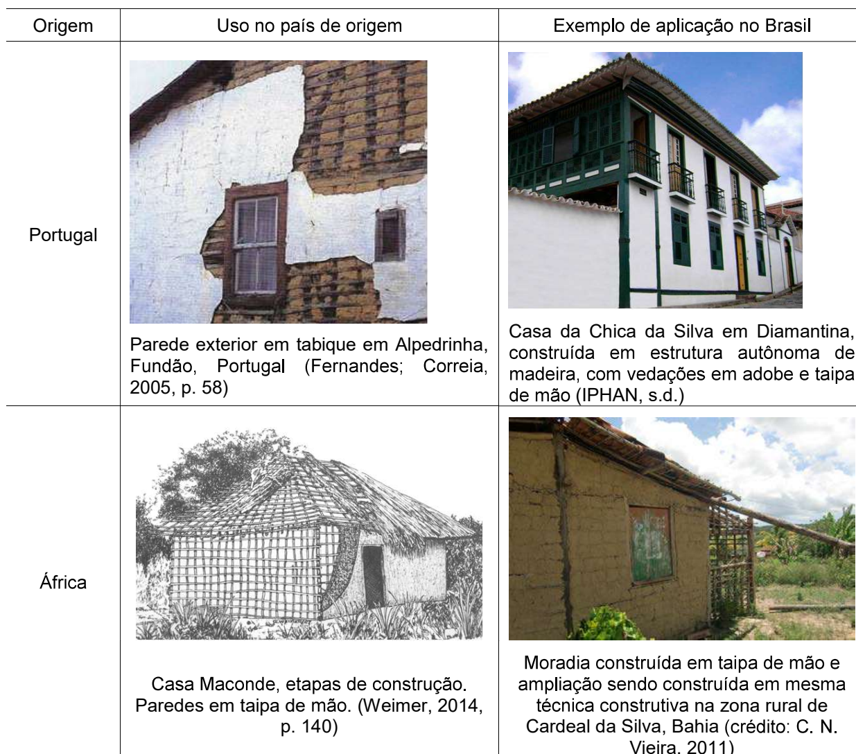
Tabela 1 - Origem da taipa de mão no Brasil

Ao chegar ao Brasil os portugueses não encontraram exemplares de taipa de mão nas edificações indígenas. Esta passou a ser utilizada no país depois da vinda dos próprios portugueses e africanos, que empregavam tradições construtivas em técnicas mistas em seus países de origem (tabela 1).